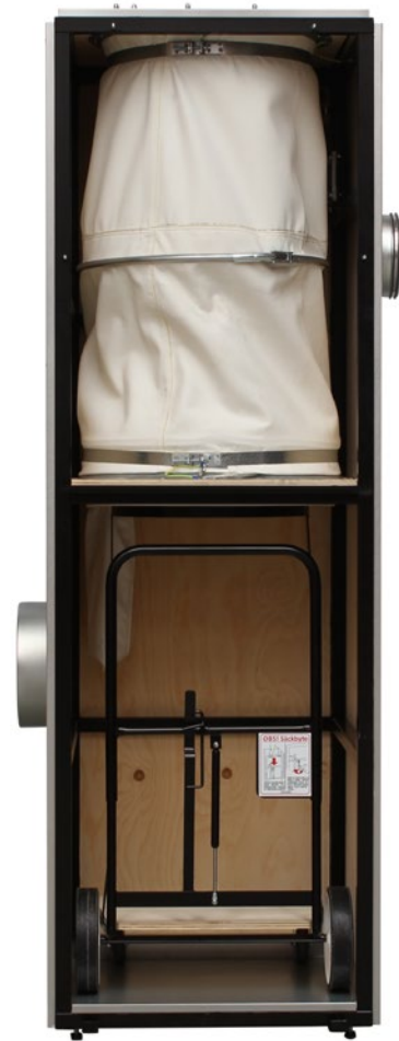
Stoftavskiljare BZ11 - öppen