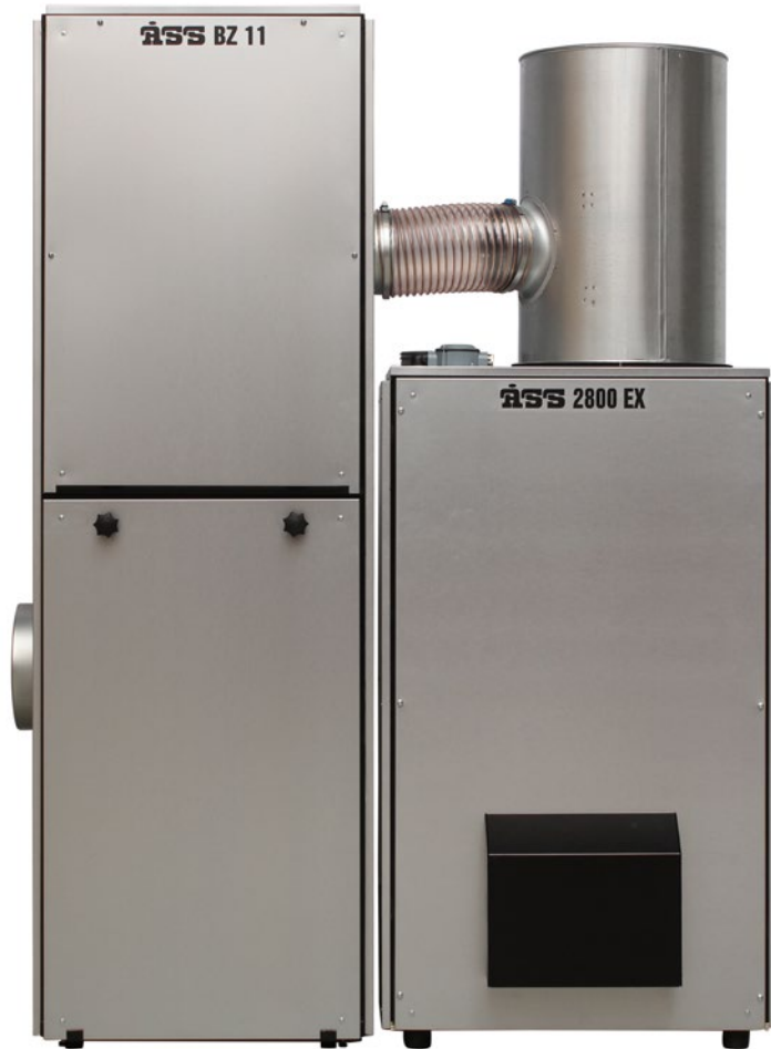
Stoftavskiljare BZ11 i kombination med ÅSS Spånsug 2800 EX