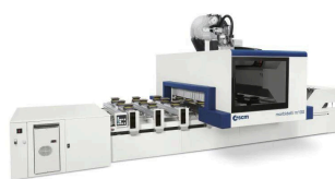
SCM Morbidelli M100