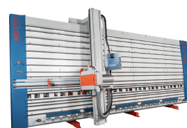
Elcon Väggsåg DSX 215