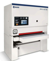
SCM Bredbandputs SD60

Provkör alla maskiner med olika material