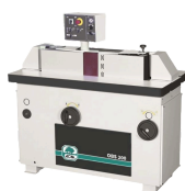
ACM Vertikalputs OBS200