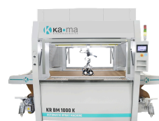
Ka ma KR BM 1000 K sprutautomat