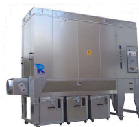
Riedex Spånsug DM300