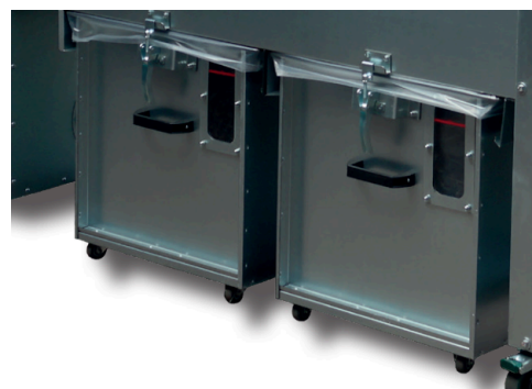
Spånbehållare med enkel tömning