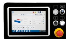
EYE-S 10" Touchskärm